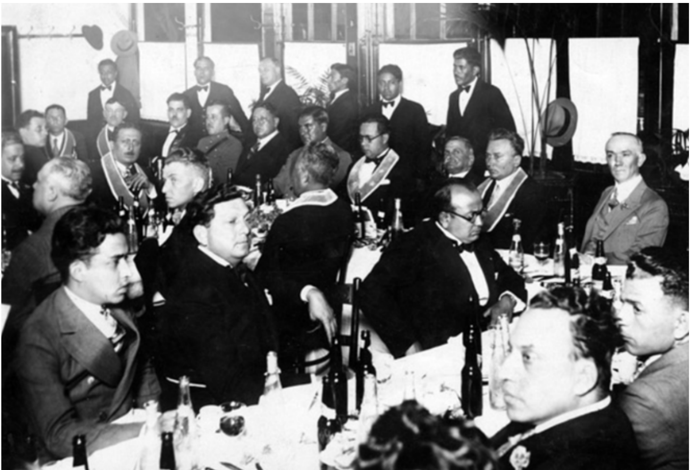
Emilio Portes Gil presidiendo solsticio de verano el 27 de julio de 1929