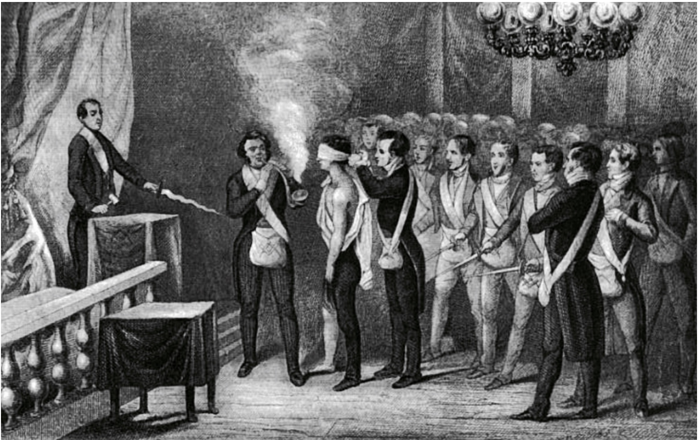
Ceremonia de Iniciación Ilustración tomada del Libro “Historia Pintoresca de la Franc-Masonería, y de las Sociedades Secretas antiguas y modernas”