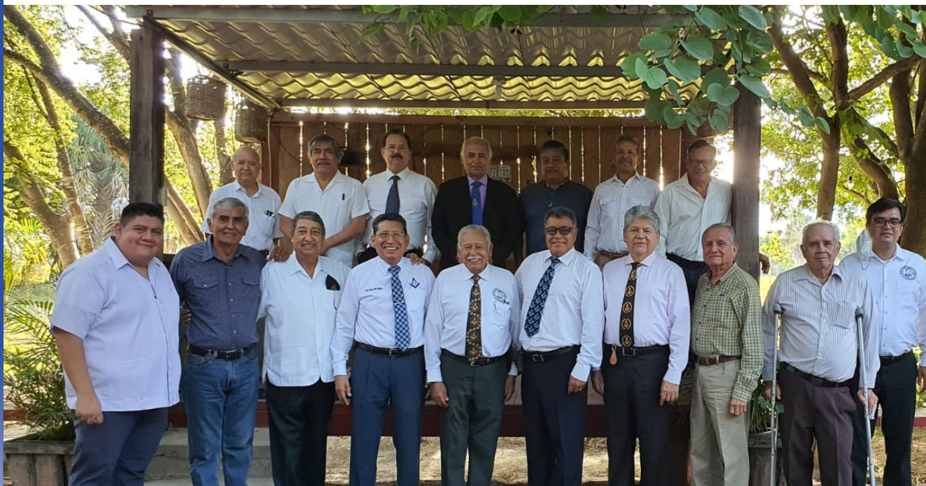
Compartiendo el pan y la sal con los QQ.: HH.: de la R.: L.: S.: “Jaumave” N°121.