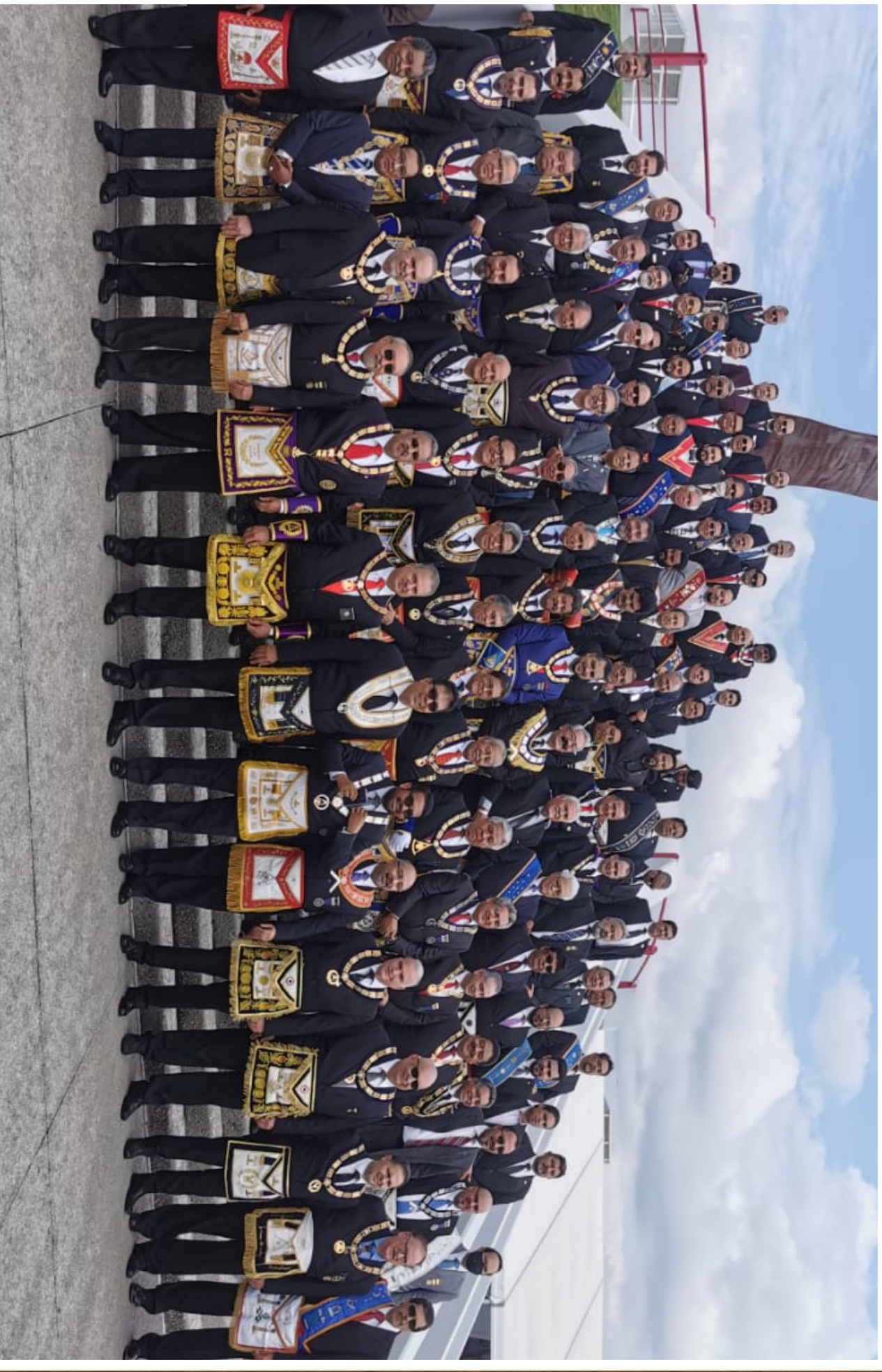
Ceremonia de inauguración del CXXXVIII Consejo Masónico Nacional de Grandes Logias Regulares de la República Mexicana, celebrada los días 9,10 y 11 de julio de 2021 en Silao, Gto.