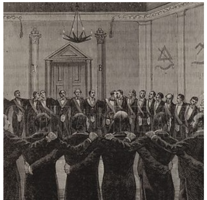
The chain of union. Illustration for Les Mysteres de la Franc-Maçonnerie Devoiles (The Mysteries of Freemasonry Revealed) by Leo Taxil (Letouzey et Ane, c 1885).

Arnoldo Vanoye Gutiérrez Gran Primer Vigilante Gran Logia de Tamaulipas