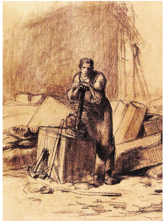
“La Masoneria Operativa” de J. F. Millet