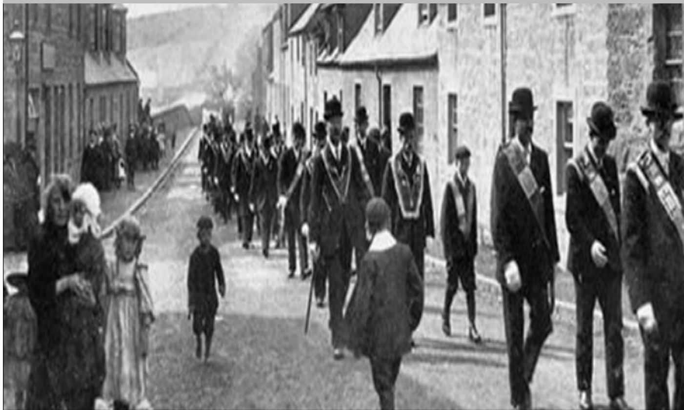
Antigua marcha masónica por las calles de Inglaterra