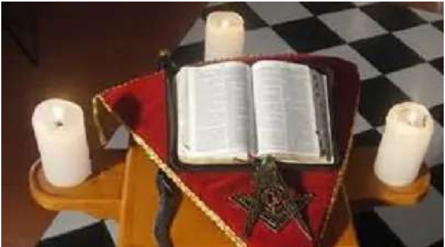
El Ara, donde se refrendan los juramentos y palabra de honor

R.: L.: S.: "Victrix" N°1 Gr.: Or.: de Tampico, Tam.