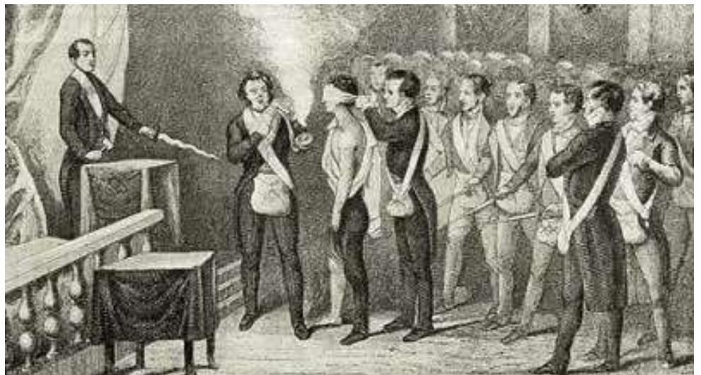
Recepción de un Joven Aprendiz, Ceremonia de Iniciación.