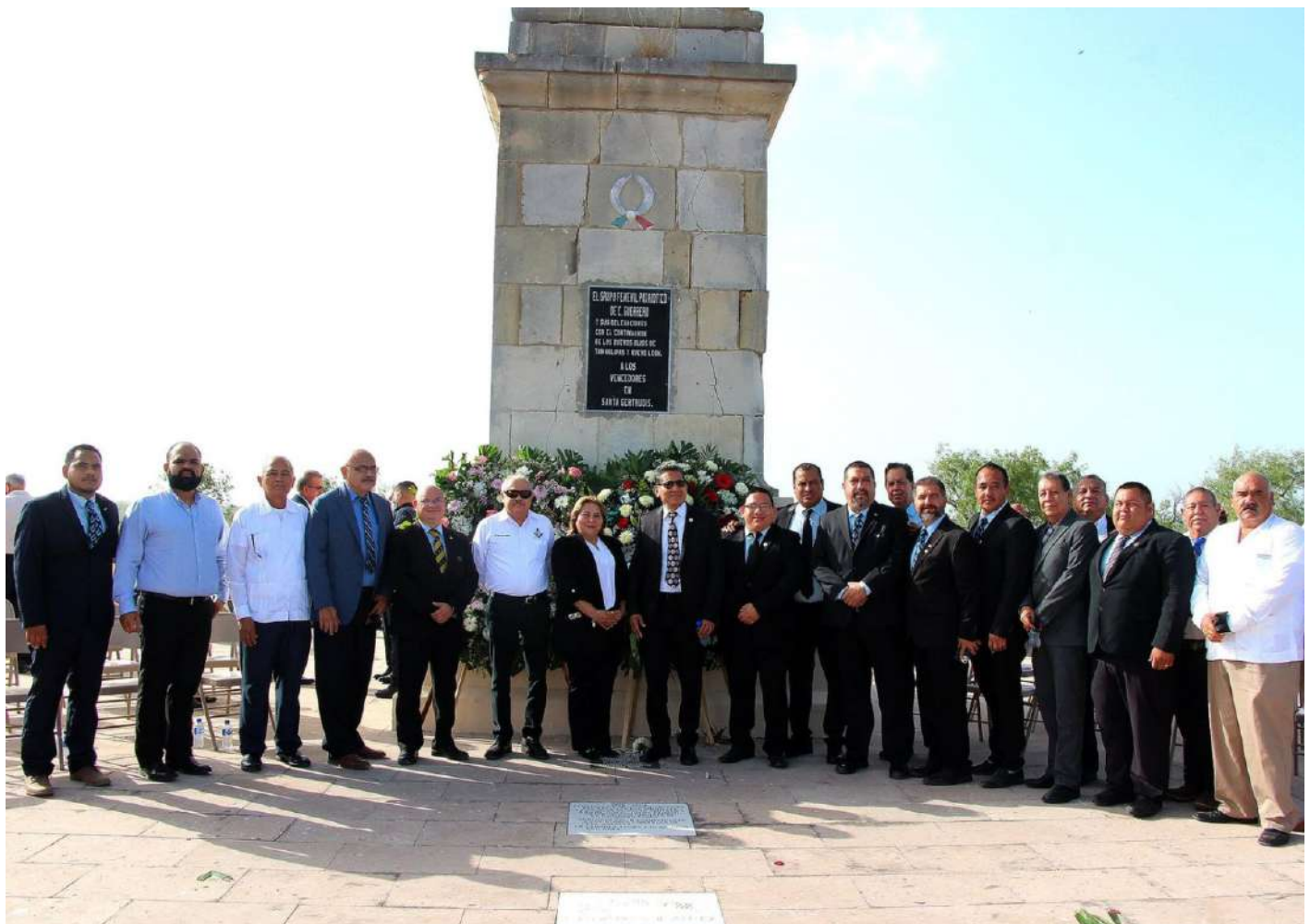
Guardia de Honor en memoria de la Batalla de Santa Gertrudis