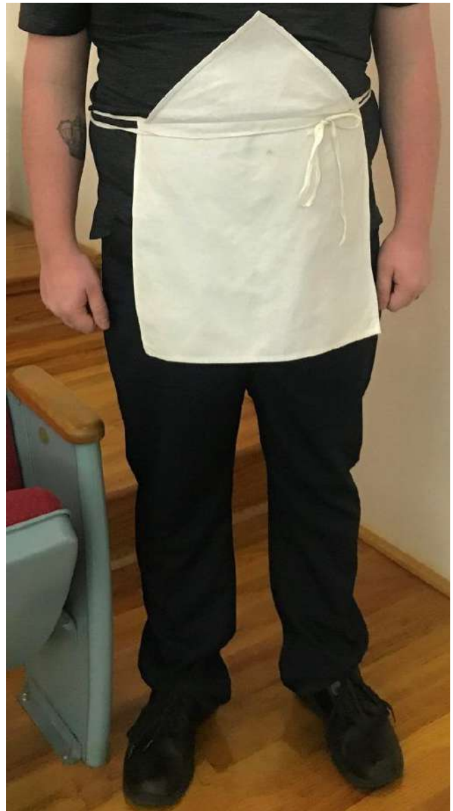
Imagen representativa de un aprendiz masón portando su mandil

R.: L.: S.: "Victrix" N°1 Gr.: Or.: de Tampico, Tam.