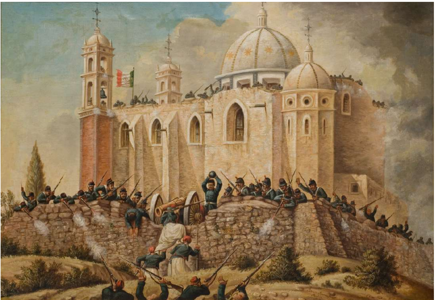
Batalla de Puebla (de la serie: Batalla de Puebla) Autor: Patricio Ramos Ortega , Año:1862. Colección Museo de Historia Mexicana